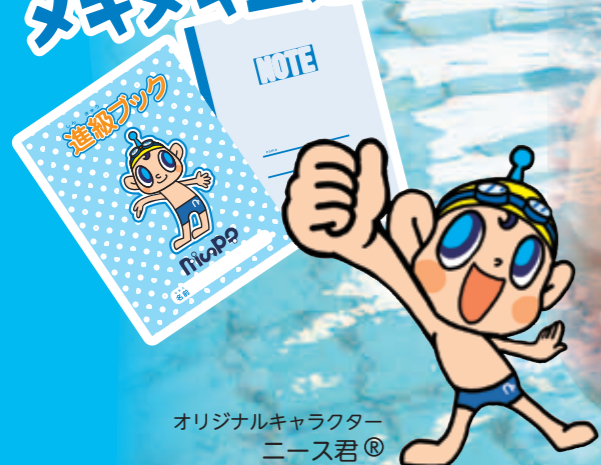
オリジナルキャラクター ニス君®