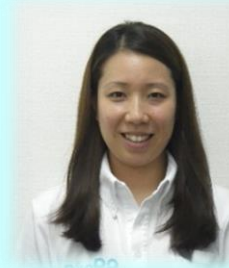
山中 選手担当コーチ